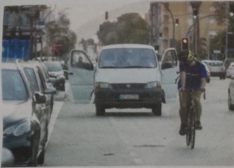
Ciclistas não estão "protegidos" entre os automóveis