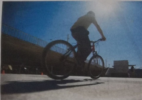
Foz do Porto: falta de sinalização e algum pavimento em mau estado

vento ou atenuando o problema do "last mile".